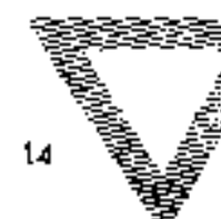
14 Az átkelőre előzetes jelzés tábla