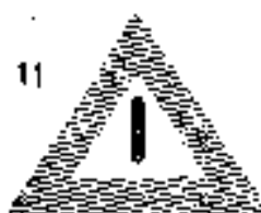
11 Egyéb veszély