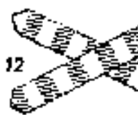
12 Vasúti kocsiszállás