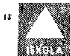
13 Vasúti kocsiszállás