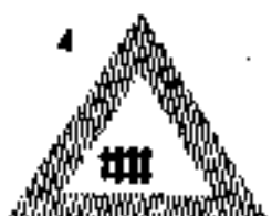
3 Vasúti kocsiszállás