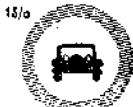
15/a Gépjármű közlekedés tilalma