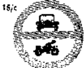
15/c Motosiklós, gépjármű közlekedés tilalma