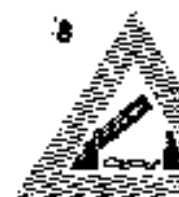
8 Nyitott út